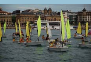
Regata de Optimist Iniciación