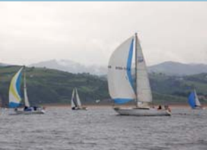
Regata de Cruceros