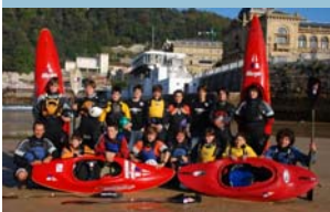
École de Canoë 2008/09

Au niveau international, la Armada Cup Race qui se déroule tous les deux ans et unissant les villes de Plymouth et de San Sebastián a une importante renommée. Il s'agit de la seule régates internationale de voiliers qui a lieu au Pays Basque.