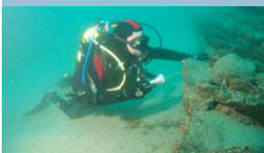
Section des Activités Sous-Marines