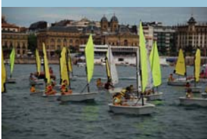
Régates d'Optimist Initiation