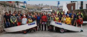
Die Segelschule 2008/09