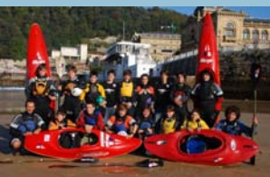
Die Kanusportschule 2008/09

nahmen an den Segelregatten teil und wurden von der sozialen und sportlichen Dimension