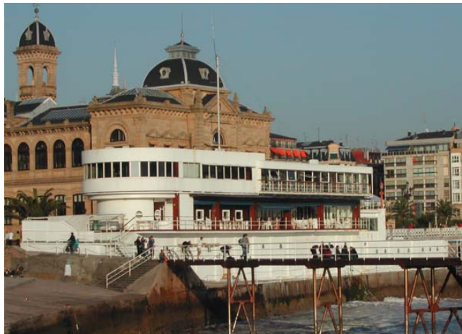
Das Gebäude des Real Club Nautico in San Sebastian heute, gesehen von dem Hafen in San Sebastian

Das Gebäude zeigt auch die außerordentliche Genauigkeit, die Aizpurua und Labayen in Linguistik der Architektur eingearbeitet haben. Es befindet sich in einer meisterhaften Umgebung und beobachtet die Bucht und den Hafeneingang in San Sebastian.