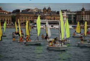
Die Segelregatta für Anfänger